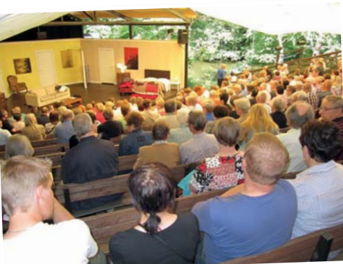
• Odottava tunnelma täydessä katsomossa ennen h-hetkeä