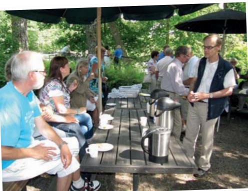
• Esityksen tauolla nautittiin tuoksuvat pullakahvit