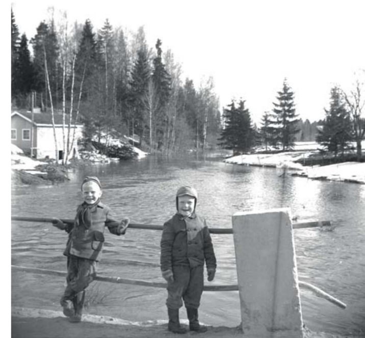
• Vanhalta maantiesillalta Korson "Tonavan" kevättulva näytti vuonna 1956 tällaiselta.

Korson sijainti lähellä lentokenttää, hyvien ja sujuvien juna- ja moottoritieyhteyksien varrella tekee Korsosta vetovoimaisen paikan asua. Korsolla on vehreyttä ympärillään, ja luonto on tärkeä osa pientaloasumista. Korson Omakotiyhdistys ry tekee osaltaan parhaansa pitääkseen Korson haluttuna paikkana asua.