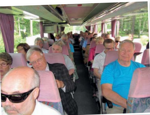
• Täysi bussilastillinen korsolaisia teatterin ystäviä matkalla Mustioon.

Parempaa päivää ei olisi voitu toivoa, sillä lämpöä riitti koko päiväksi. Menomatalla pysähdytiin lounaalle, teatterissa nautittiin hauska kappaleesta, ihailtiin kaunista puistoa ja paluumatkalla levähdettiin Kasvihuoneilmiössä Sammatissa.