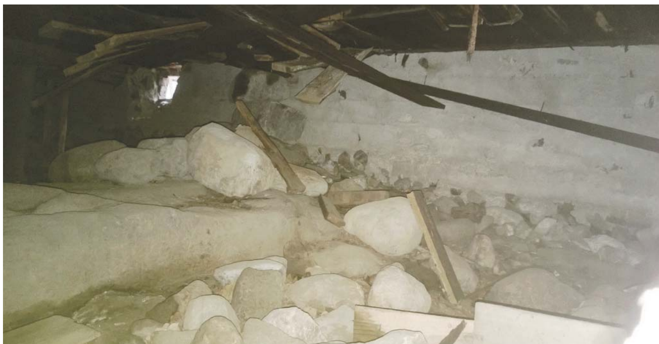
Kevään sulavesien seisominen talon alla ja orgaaninen maa-aines kehittävät tehokkaasti homeita ja lahosientä alapohjan rakenteisiin.

Teksti ja kooste: Hannele Puusa-Ruohonen