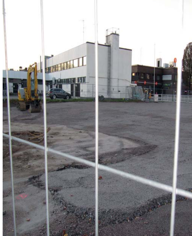
Aidattu tontti on Korson keskeisintä rakennusmaata.